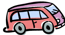
Spielmobil „Peppermint Patty“

Fast jedes Wochenende im Sommer wird es für die verschiedensten Freiluftveranstaltungen in Lage und Umgebung gebucht.